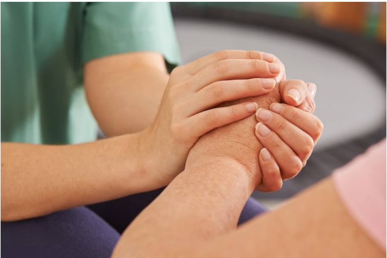
Pflegearbeit in der Familie wird überwiegend von Frauen geleistet. Für die kfd ist das ein zentrales Thema.

Jede*r ist eigenständig abgesichert durch Erwerbsarbeit , die so strukturiert ist, dass sie im Lebensverlauf zugunsten von Sorgearbeit eingeschränkt und flexibel ausgestaltet werden kann. Zeitweilige Verminderung von Erwerbsarbeit für Erziehungs-, Pflege- oder ehrenamtliche Tätigkeiten wirkt sich nicht auf Bezahlung und Aufstiegsmöglichkeiten aus.