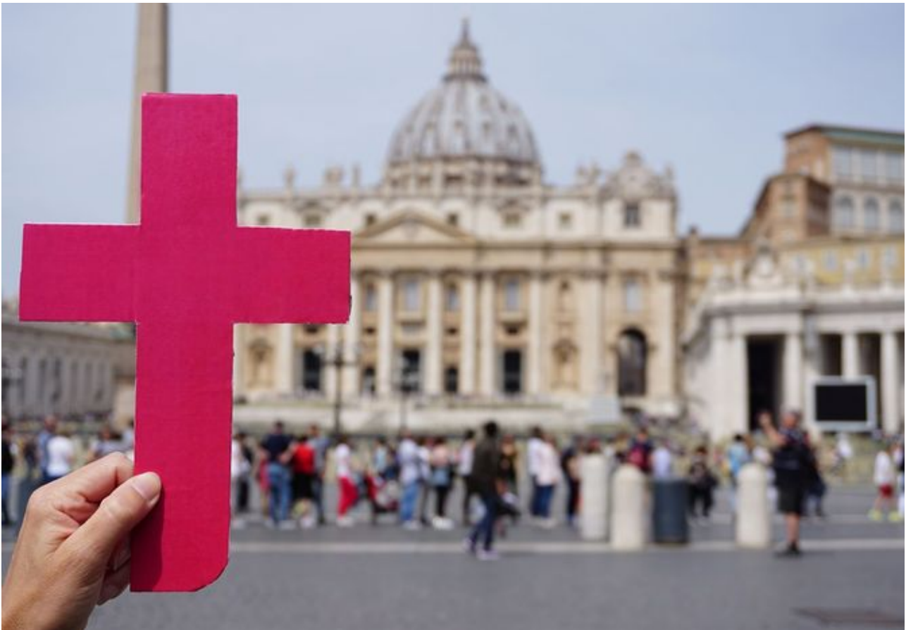
Das Purpurkreuz - kfd-Symbol für die Forderung nach einer geschlechtergerechten Kirche.

Durch coronabedingte neue Formen des Austauschs und Gebets können wir Facetten unseres Glaubens neu entdecken und intensiver leben. Im Vordergrund stehen die prophetische und befreiende Verkündigung und der Wert einer jeden Person in ihrer Einzigartigkeit. Durch die Liebe Gottes erfahren wir die Kraft, liebend in unserer Gemeinschaft und Gesellschaft tätig zu werden.