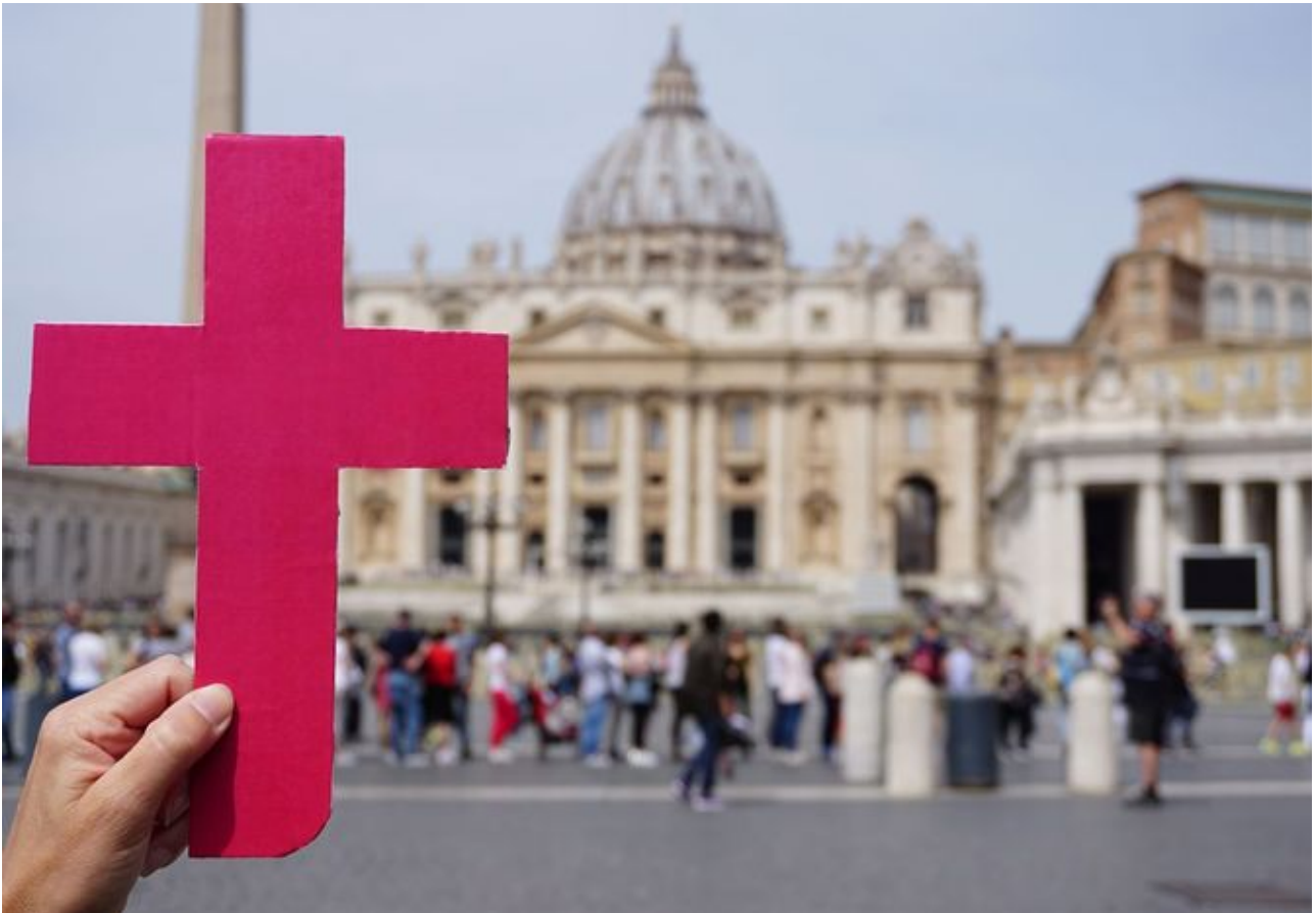
Das Purpurkreuz - kfd-Symbol für die Forderung nach einer geschlechtergerechten Kirche.

Wir wollen eine Kirche, in der alle Menschen gleich und als Ebenbilder Gottes anerkannt sind. Frauen und Männer sind gleichermaßen in die Nachfolge Jesu berufen. Dazu gehört die Zulassung von Frauen zu allen Weiheämtern , damit Frauen ihre Berufungen gleichberechtigt leben können.