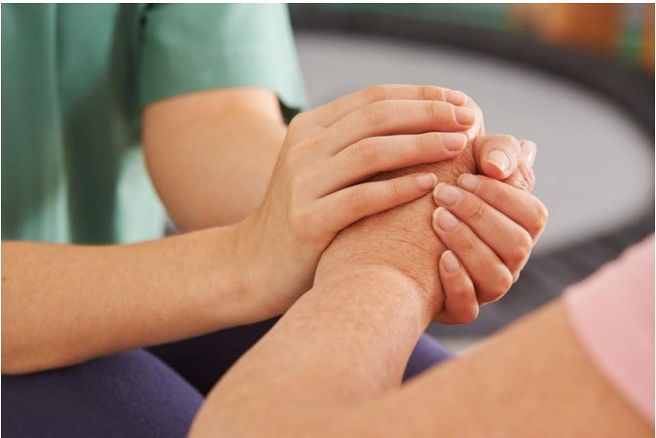
Pflegearbeit in der Familie wird überwiegend von Frauen geleistet. Für die kfd ist das ein zentrales Thema.

Jede*r ist eigenständig abgesichert durch Erwerbsarbeit , die so strukturiert ist, dass sie im Lebensverlauf zugunsten von Sorgearbeit eingeschränkt und flexibel ausgestaltet werden kann. Zeitweilige Verminderung von Erwerbsarbeit für Erziehungs-, Pflege- oder ehrenamtliche Tätigkeiten wirkt sich nicht auf Bezahlung und Aufstiegsmöglichkeiten aus.