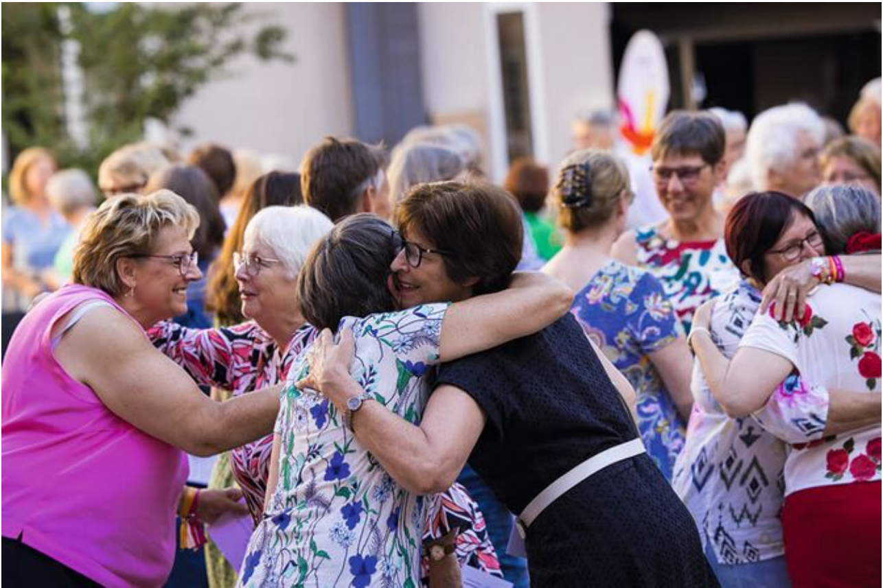
Die kfd - eine Gemeinschaft, die trägt.

Gesellschaft und setzen uns für ihre Rechte ein.