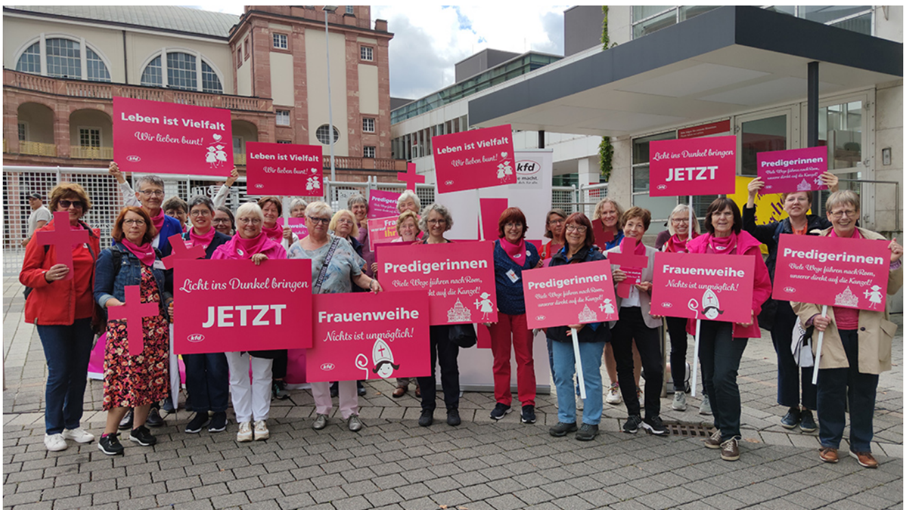
Die kfd - eine starke Stimme in Kirche, Politik und Gesellschaft.