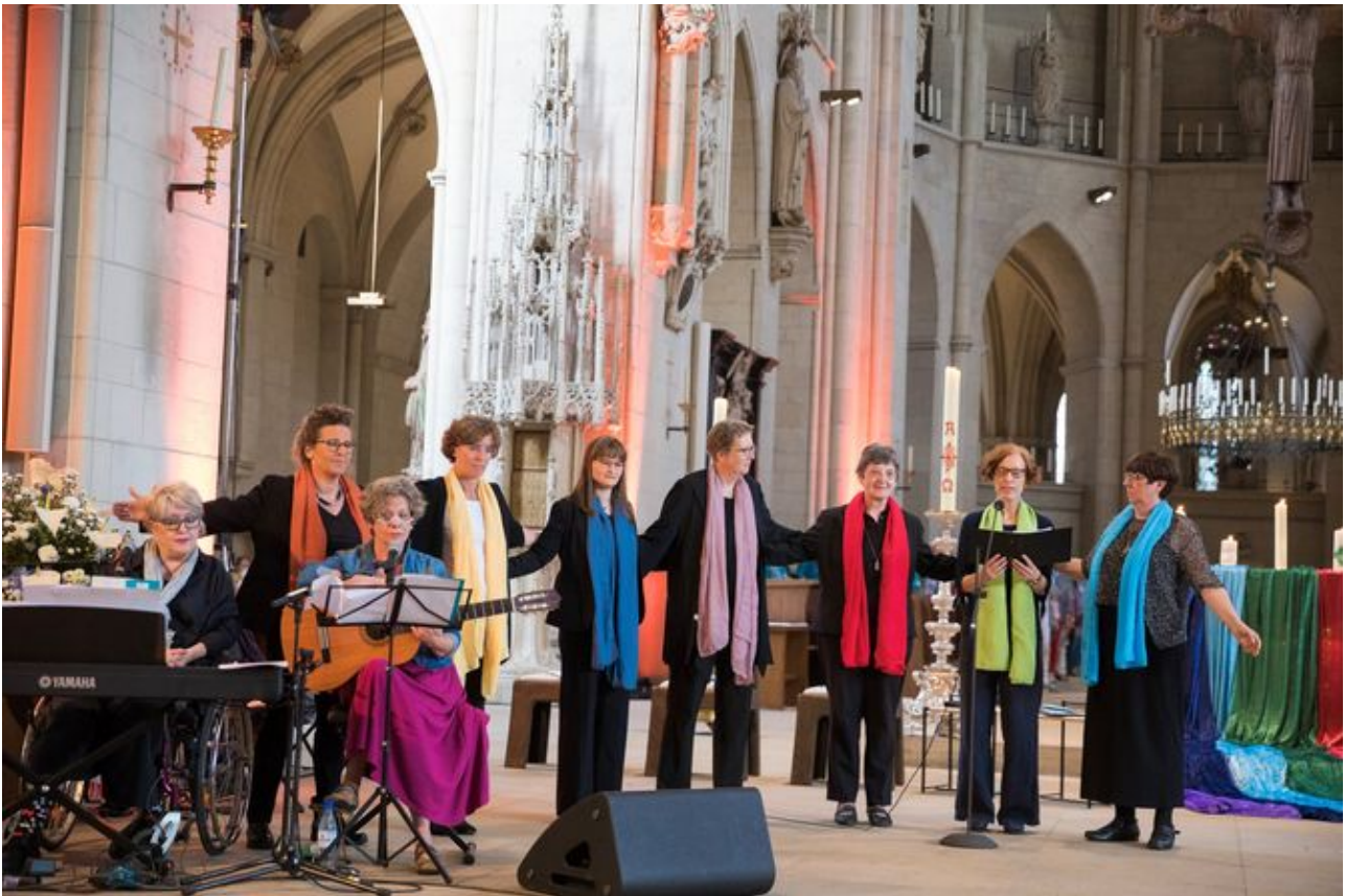
Ökumenischer Frauengottesdienst beim Katholikentag 2018 in Münster.