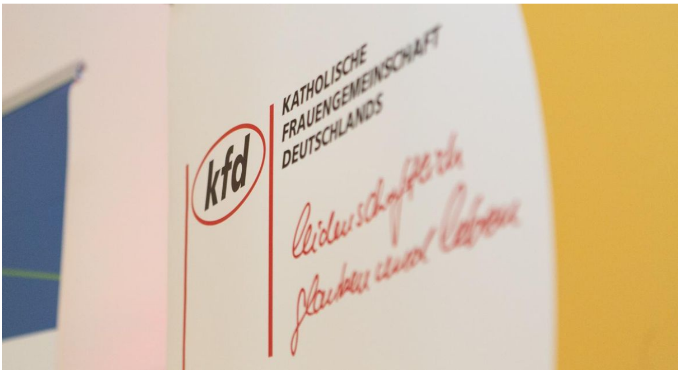
Das kfd-Leitbild.

Das Leitbild des Verbandes: "kfd - leidenschaftlich glauben und leben"