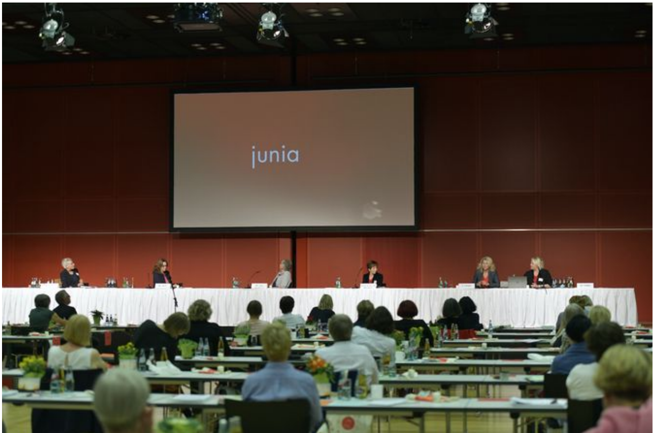
Die Delegierten der kfd-Bundesversammlung beschlossen im September 2020 in Mainz einstimmig die Namensänderung.

In Jesu Gefolgschaft befanden sich jedoch auch Frauen, ihre Namen werden teilweise nicht einmal genannt. Die Bibel entstand in einer patriarchalen Gesellschaft. Aber Jesus hat Frauen wertgeschätzt, einen anderen Umgang vorgelebt. Das ist die Botschaft, die wir heute weitertragen können und wollen.