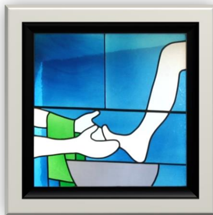
Bild: Kloster Illanz, Klosterkirche, Glasfenster von Max Rüedi, Quelle: Wikimedia

Mit seiner symbolischen Handlung setzt Jesus Maßstäbe.