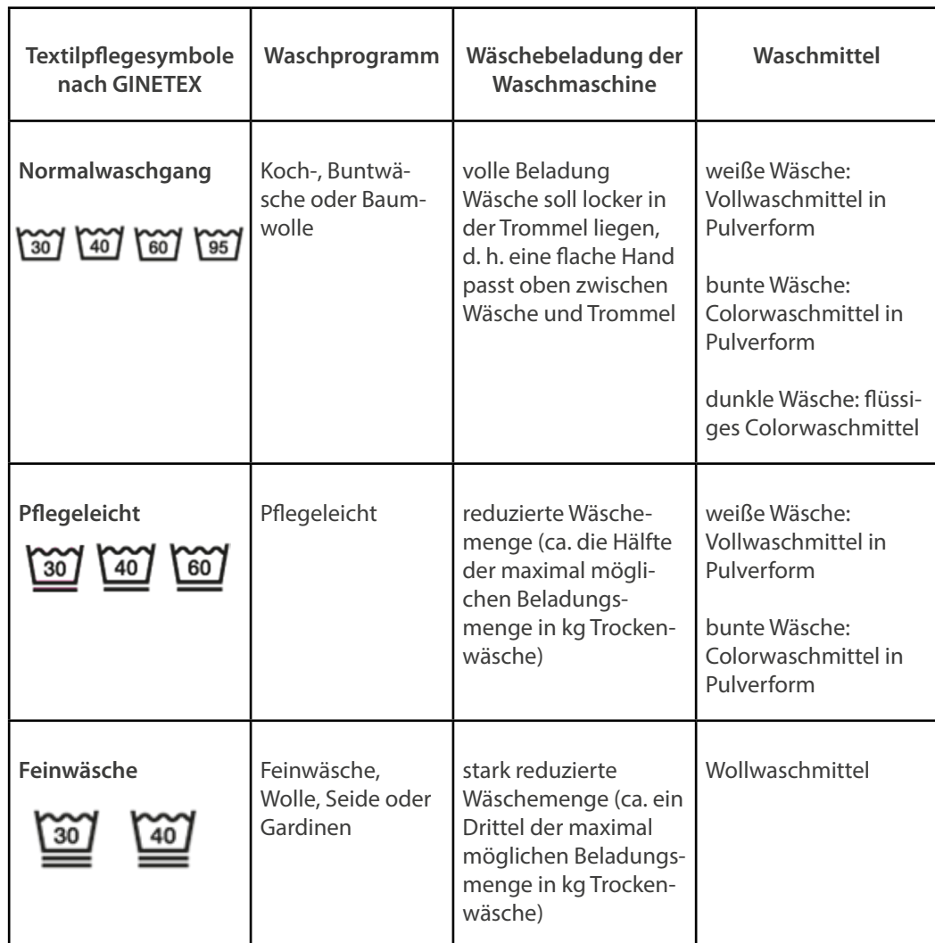
Tabelle 2: Das Wichtigste im Überblick