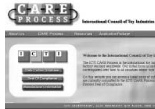
Unter www.icti-care.org informiert der Weltverband über die ausgestellten Bestätigungen und das Date Certain-Programm.